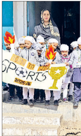
बराड़ा। खेल में भाग लेने वाले खिलाड़ी।

अकाल अकादमी होली में वार्षिक स्पोर्ट्स डे बड़े उत्साह और जोश के साथ मनाया गया। पूरे कार्यक्रम के दौरान छात्रों में खेल भावना और ऊर्जा का अद्भुत जोश देखने को मिला। कार्यक्रम की शुरुआत सुबह एक छोटी सभा और वार्म-अप सत्र से हुई। इसके बाद विभिन्न कक्षाओं के छात्रों के लिए कई रोचक खेल प्रतियोगिताएं आयोजित की गईं। इनमें सरल दौड़, बैग-पैकिंग रेस, बैलून रेस, बुक रेस, लंबी कूद, शॉट-पुट और नींबू-चम्मच दौड़ प्रमुख आकर्षण रहीं। सरल दौड़ और नींबू-चम्मच दौड़ ने दर्शकों में रोमांच और उत्साह भर दिया। बैग-पैकिंग रेस और बुक रेस जैसी गतिविधियों ने छात्रों की गति, फुर्ती और संतुलन की परीक्षा ली, वहीं बैलून रेस ने कार्यक्रम में मनोरंजक माहौल