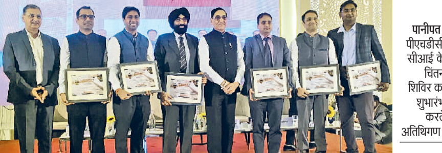
पानीपत। पीएचडीसीसीआई के चिंतन शिविर का शुभारंभ करते अतिथिगण।