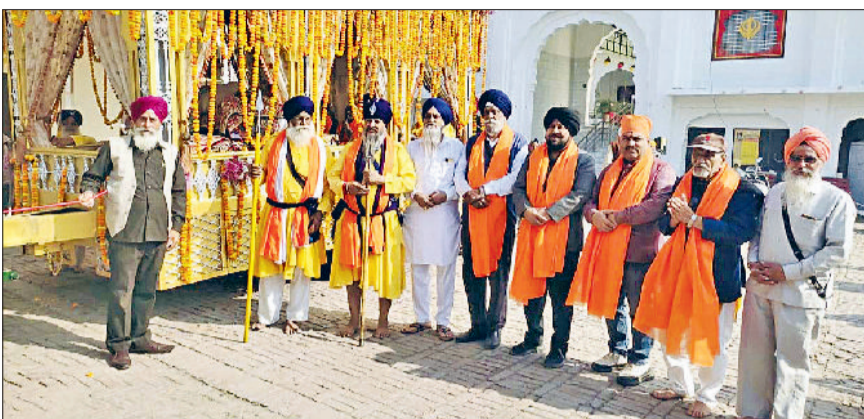
करनाल। पालकी साहिब का स्वागत करते हुए एवं संगत को सिरोंपा भेंट करते हुए दृश्य।