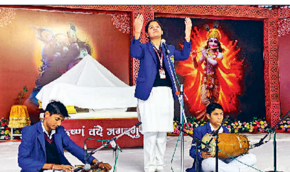
कुरुक्षेत्र। गीता श्लोकोच्चारण प्रतियोगिता में प्रस्तुति देते हुए विद्यार्थी।