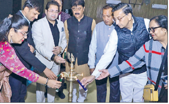
पानीपत। गीता पर सेमिनार का दीप जला कर शुभारंभ करते हुए अतिथिगण।