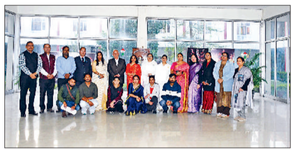
बराड़ा। कार्यशाला में भाग लेने वाले प्रतिभागी।