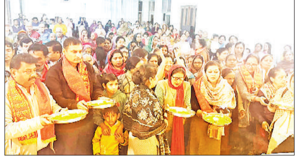
अंबाला। शिव कथा के समापन पर आरती करते श्रद्धालु।

उन्हें तुरंत गिरफ्तार कर अदालत में पेश किया जाए। मंत्री की फटकार के बाद पुलिस ने तेजी दिखाते कुल 5 आरोपियों को गिरफ्तार कर लिया। आरोपियों पर युवती का पीछा करने, घर में घुसकर मारपीट करने और जान से मारने की धमकी देने जैसे आरोप हैं।